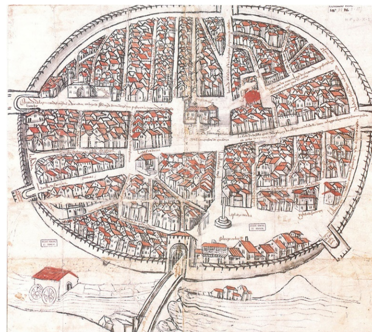
Aranda de Duero Map. Archivo General de Simancas. Mapas, Planos y Dibujos. X-1