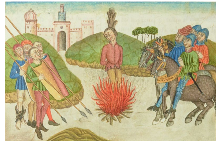
Miniatura del Libro del Caballero Zifar / Miniature of the Book of the Knight Zifar (Paris, Bibliothèque Nationale, Espagnol 36)