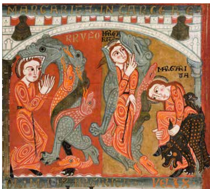
Detalle del frontal de altar de Santa Margarida de Vilaseca

La exposición temporal 'Bèsties. Los animales en el arte medieval del MEV' se podrá visitar desde este mes de marzo y hasta diciembre