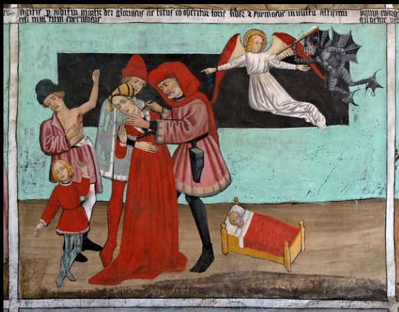
Fragment de frescos de la capella de Sant Sebastià de Lanslevillard (Savoia, França), de finals del segle XV

The register of epidemics in the narrative sources of the Crown of Aragon (mid-13th century to end of 16th century)