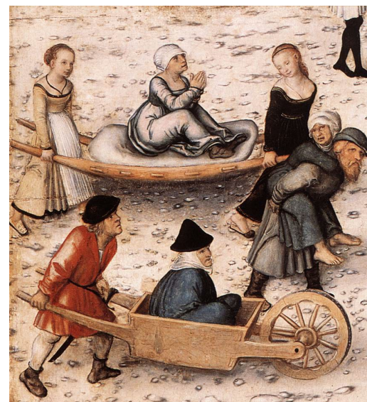
Detalle de La Fuente de la Juventud de Lucas Cranach. Museo estatal de Berlín