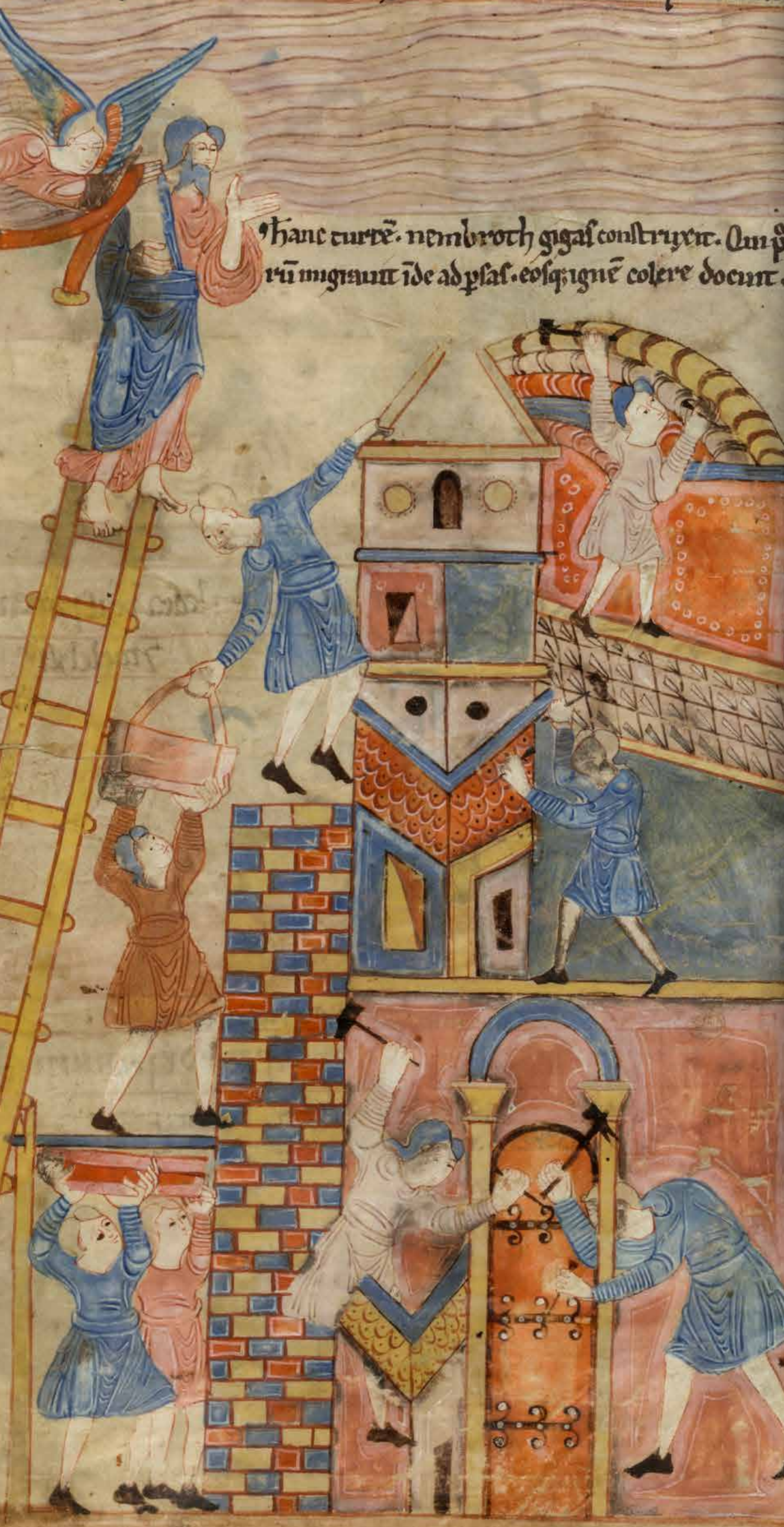
Imagen / Irudia Construcción de la torre de Babel Babelgo dorrearen eraikuntza Old English Hexateuch Canterbury, S. XI London, British Library, Cotton Claudius B. iv, folio 19 recto