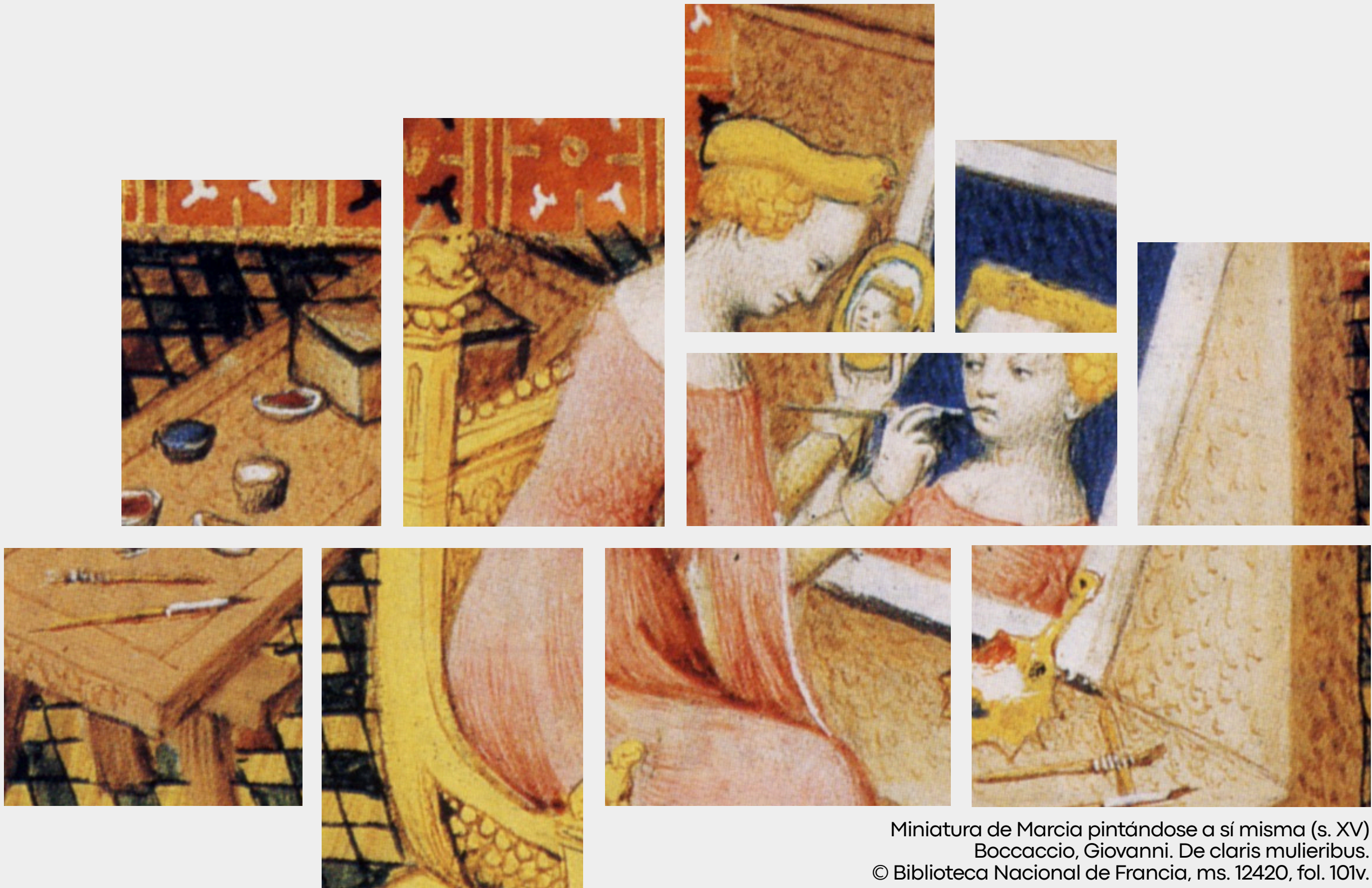
Miniatura de Marcia pintándose a sí misma (s. XV) Boccaccio, Giovanni. De claris mulieribus.