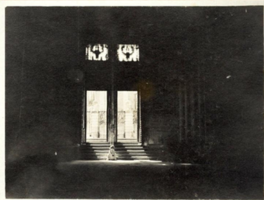
Anónimo (ca. 1909) Museo Casa de los Tirones, Granada