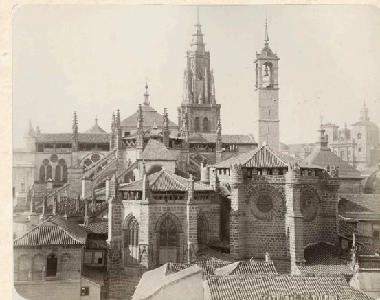
Casiano Alguacil (ca. 1880) Archivo Municipal de Toledo