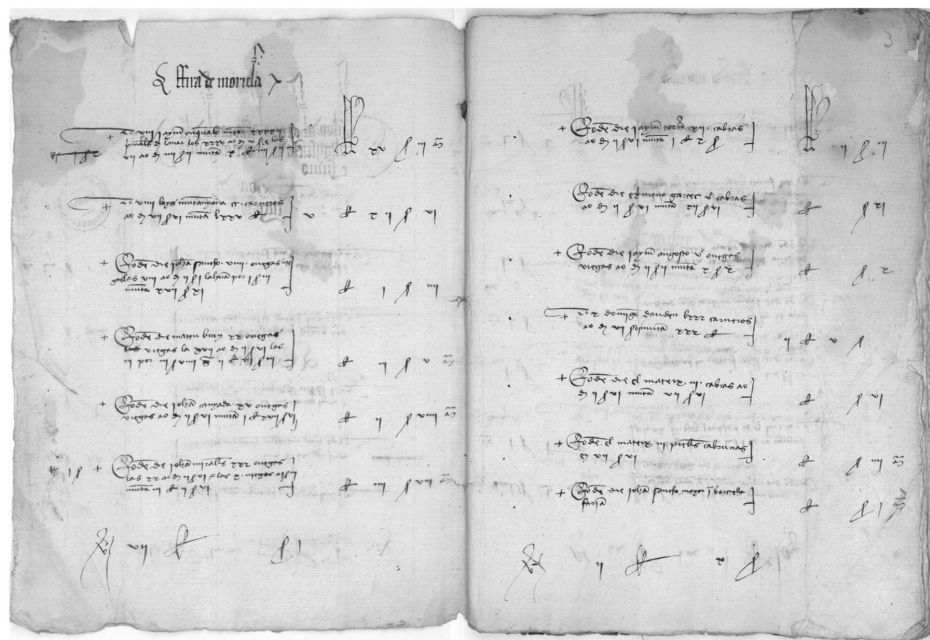
Libro de la aduana de La Iglesuela del Cid para el año fiscal 1451-1452 (ADZ, Leg. 763-2, fol. 2v-3).

intercambio comercial a partir del análisis de ferias y mercados nos puede ayudar para conocer el desarrollo de una región económica. Ningún término de la bailía de Cantavieja cuenta con privilegio de feria, y sólo Cantavieja (1225) y Mirambel (1292) cuentan con privilegio de mercado 22 . Las ferias más cercanas son la citada anteriormente de Puertomingalvo (1354, feria y mercado), Mosqueruela (1366, feria y mercado), San Mateo (1255 la feria y 1243 el mercado) y Morella (1257, feria y mercado) 23 . La distribución de collidas cubre las zonas fronterizas y principales nudos de comunicaciones del interior. Su reorganización se lleva a cabo en las Cortes en 1446 para afrontar la crisis padecida por la Hacienda del General 24 . La red de puestos aduaneros queda establecida de tal manera que las tablas de los lugares de la bailía de Cantavieja pertenecen a la sobrecollida de Montalbán-Barracas compuesta de 27 collidas, de las que 16 son fronterizas recaudando en total entre el 5 y el 10 % de las Generalidades. En comparación con los datos de