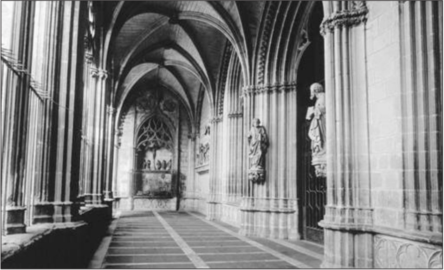
Vista del claustro de la catedral de Pamplona.

bajomedievales. El ceremonial funerario, cuyo modelo remitía a Francia, fue una de las nuevas manifestaciones al servicio de la propaganda monárquica que se utilizó ya con Felipe III (1328-1343), esposo de Juana (1328-1349) y padre de Carlos II.