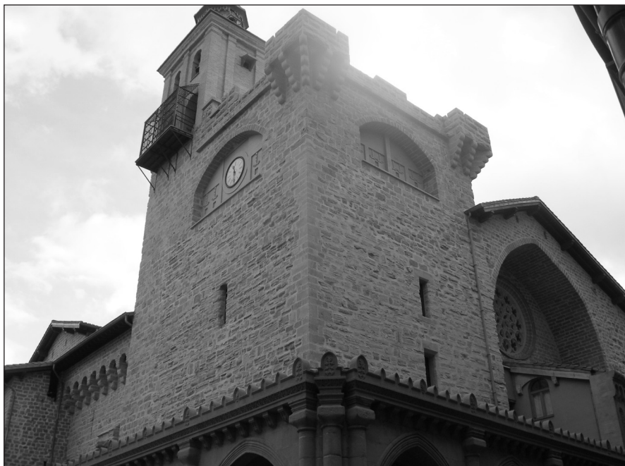
Iglesia de San Nicolás de Pamplona.