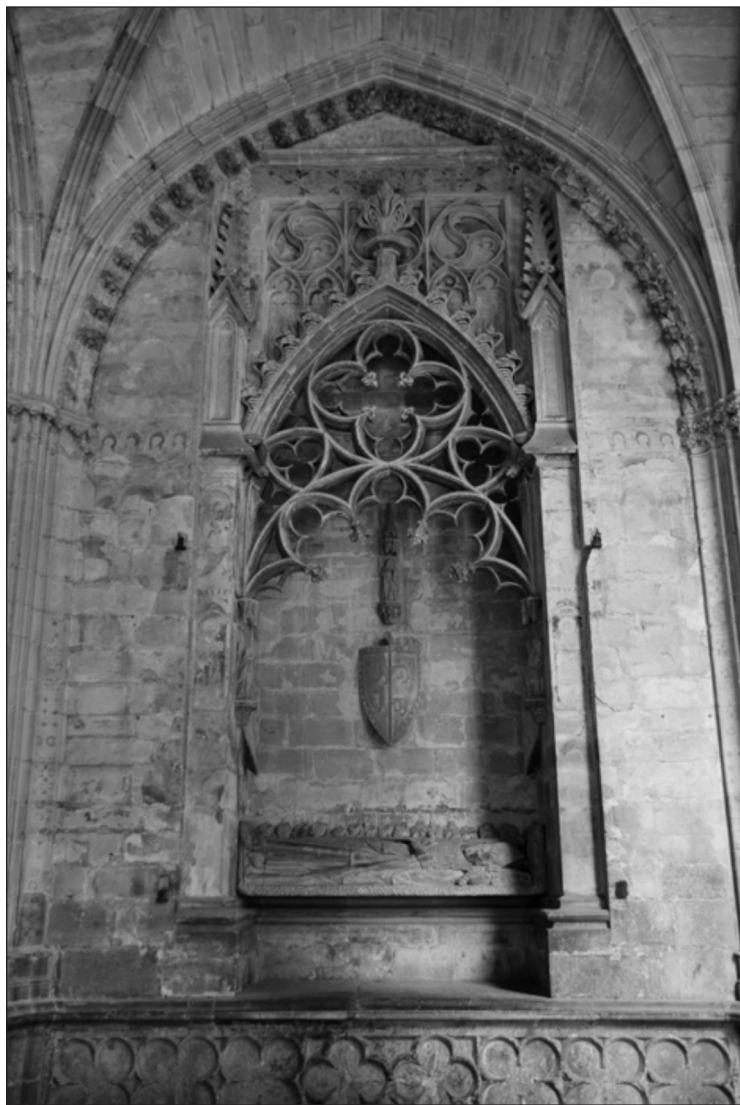
Sepulcro de Miguel Sánchez de Asiáin (Claustro de la catedral de Pamplona).