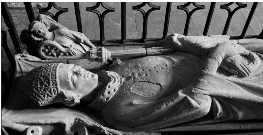
Sepulcro del obispo Arnaldo de Barbazán.

claramente que faziendol saber el mayoral que li coste .VI. dineros por cada uegada sin mercet ninguna , y en la de Santo Tomás apóstol (1430) se advertía a todo aquell que no yrá a bisitar, como dicto es, que pague por cada vegada, III dineros fuertes.