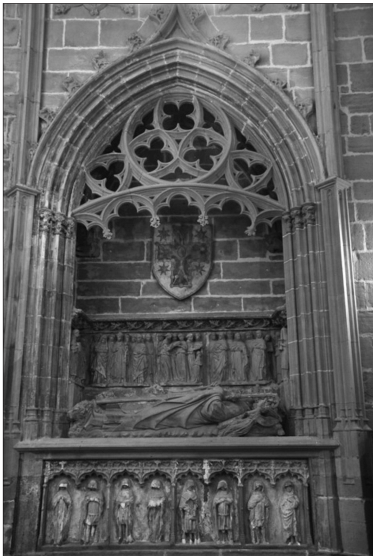
Sepulcro de Sancho Sánchez de Oteiza (Claustro de la catedral de Pamplona).