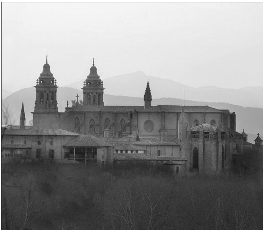
Catedral de Pamplona.

[...] Comando mi anima a nostro Seynor Ihesu Xhristo qui muert et passion quiso rezebir por mi pecador del poder del diablo redemir.