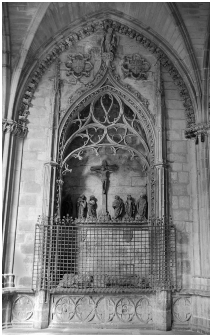
Sepulcro de Per Arnaut de Garro (Claustro de la catedral de Pamplona).