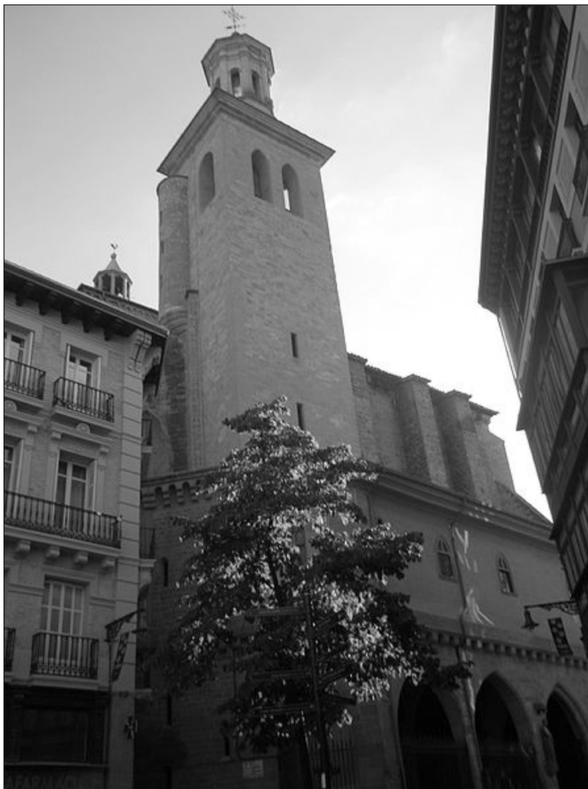
Iglesia de San Saturnino (Pamplona). Fuente: Wikipedia.