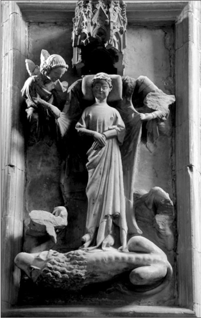
Lápida sepulcral de una princesa navarra en la catedral de Pamplona (sobre la portada de acceso al Claustro).