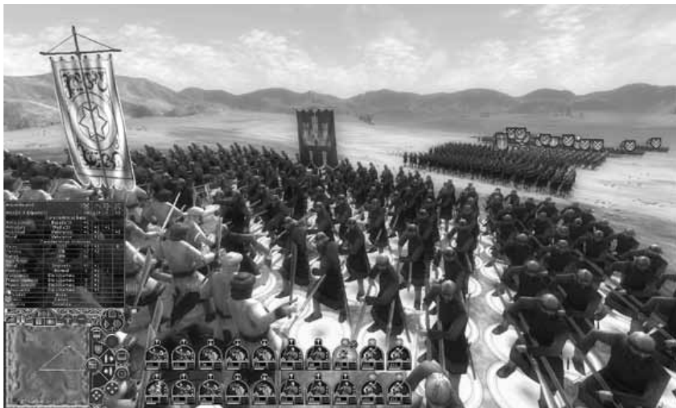
Ilustración 6.— Batalla de las Navas de Tolosa.

Es el mismo sentido que le encontramos al alineamiento con una de las facciones musulmanas contra los cruzados. No es el mismo proceso, pues en el caso que pa-