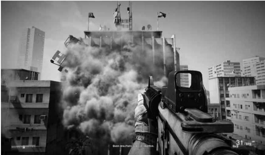
Ilustración 1.— Battlefield 3 . Explosión en Bagdad.

ña un papel fundamental, pues el jugador desea utilizar el videojuego, o lo que es lo mismo, interactuar con él. Insisto en que no se trata de un elemento pasivo, sino que la actividad es uno de los elementos de su idiosincrasia.