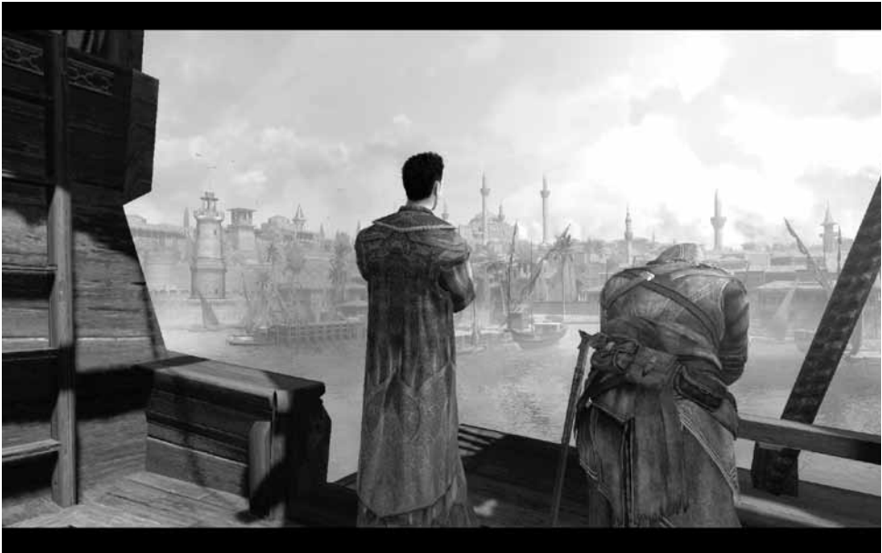
Ilustración 9.— Assassin's Creed . Revelations.