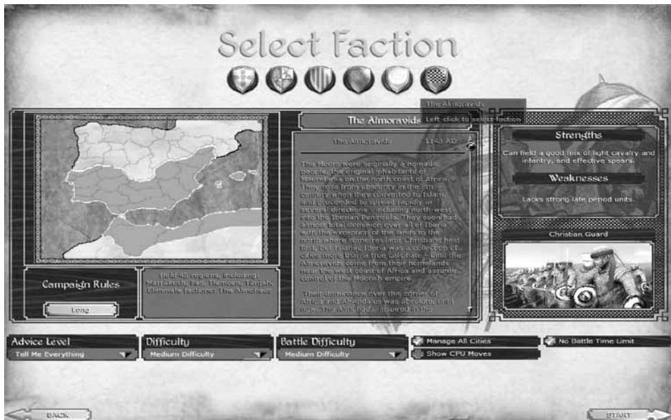
Ilustración 5.— Medieval Total War II . Mod de la Reconquista. Facción almorávide.

Hemos aludido conscientemente a este hecho porque se produce el desarrollo de un sentimiento, auténtico faro guía del jugador, que anhela cubrir un deseo