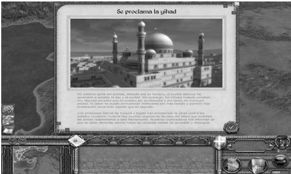
Ilustraciones 3 y 4.—Expansión Kindgoms. Campaña cruzada.