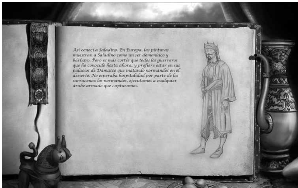
Ilustración 2.— Ages of Empires II . Inicio de la campaña Saladino.

Assassin's Creed (Ubisoft, 2007), sobre todo en el primer título de la saga, ubicado en 1191 en Tierra Santa, y por otros títulos de distinto canal, caso de la película El Reino de los Cielos –Cruzada en Iberoamérica, Ridley Scott, 2005 15 -. Este tipo de planteamientos inducen, sin duda, a la generación de un concepto unilateral y sin matices de los hechos pretéritos. El videojuego no busca educar de forma intrínseca, y precisamente por este motivo consideramos que es en esta faceta donde el medio necesita del educador, elemento que no siempre se halla cerca del acto del juego-jugador.