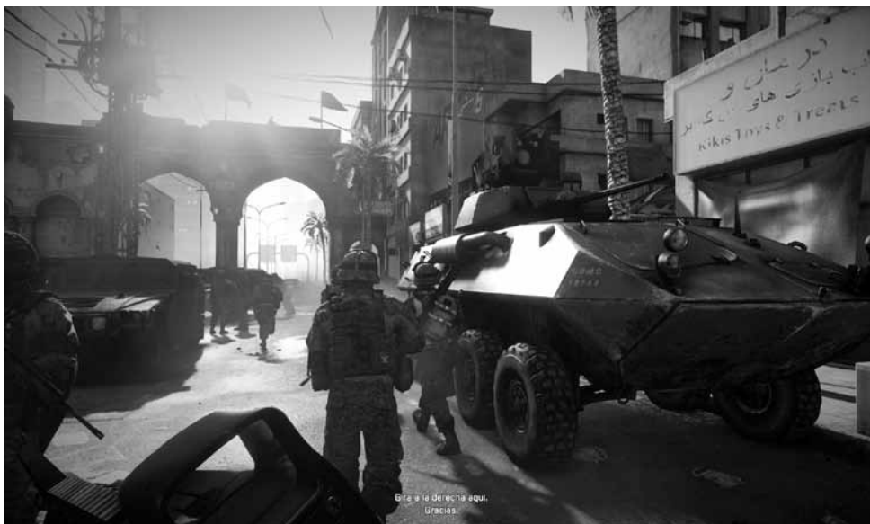
Ilustración 10.— Battlefield 3 . Patrullando por las calles de Bagdad.

a la contestación con las mismas armas, nunca mejor dicho. Se realizó por parte del régimen iraní, a través de la Fundación Nacional de Irán para los Videojuegos, un título donde se atacaba Tel Aviv. Lo peculiar es que ese mismo modelo de “enemigo declarado” se refleja también en esa réplica, pues el estado israelí nada tiene que ver con la empresa desarrolladora Electronic Arts . Por supuesto que Battlefield 3 fue prohibido por las autoridades del país islámico e incluso hubo movimientos para prohibir su evolución como multijugador en la red. Se debate y combate también en el videojuego, a manera de una nueva Guerra Fría. Baste recordar que el Sindicato de las Asociaciones Islámicas para Alumnos iraní, como respuesta a un título previo denominado Asalto en Irán , que representaba un ataque estadounidense a instalaciones nucleares iraníes, desarrollaron Rescate del científico Nuke . Actualidad simulada, o reflejo digital de un tiempo posible.