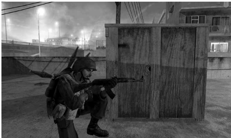
Ilustración 11.— Call of Duty Modern Warfare . Soldado musulmán en escenario impreciso de Oriente Medio.