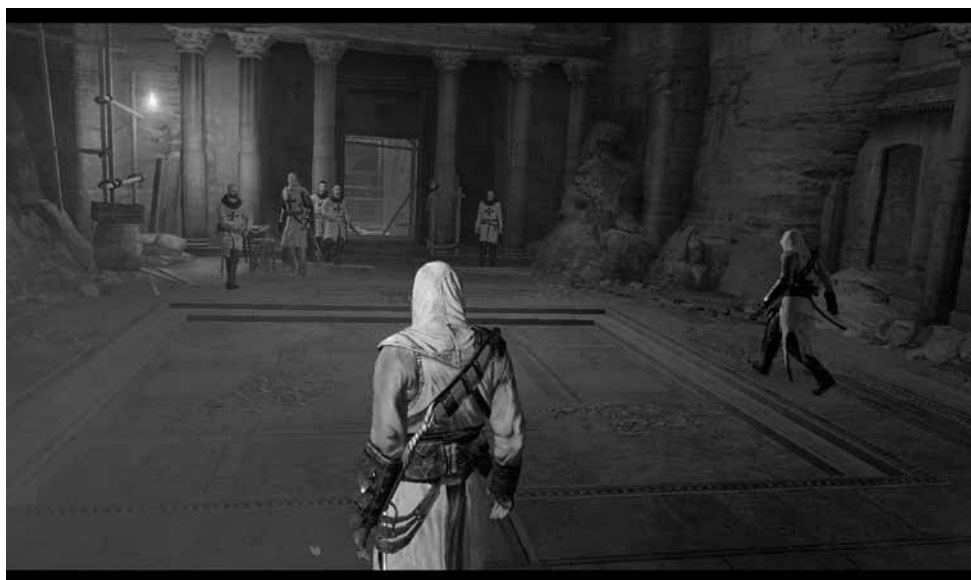
Ilustración 7.– Assassin's Creed . Escena en el Templo de Salomón.

La continuación del juego en los títulos siguientes no abandonan esta base ideológica: la primera pantalla que encontramos en todos ellos es que el videojuego está realizado por “un equipo multicultural de diferentes creencias religiosas” (ilustración 8). Y en Assassin's Creed. Revelations , que se desenvuelve en la Constantinopla