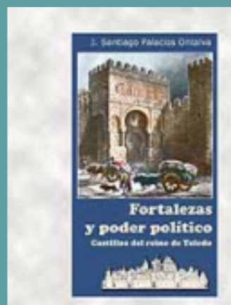
Fortalezas y poder político. Castillos del reino de Toledo , AACHE Ediciones