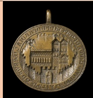
Matriz para sello de la ciudad de Boppard, 1228-1236 Alemania Aleación de cobre