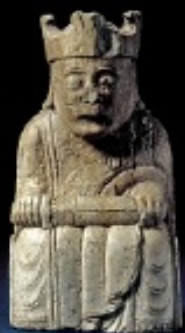
Rey del juego de ajedrez de Lewis, 1150- 1200 Posiblemente Noruega, encontrado en Escocia Marfil de morsa