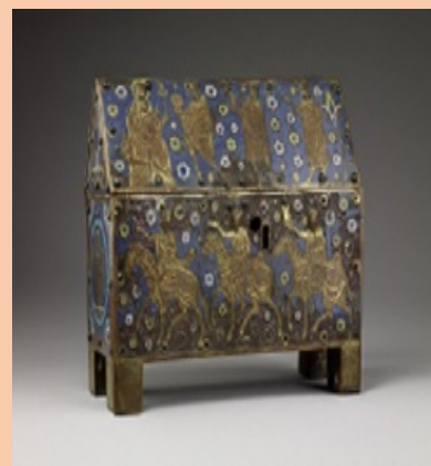
Cofre relicario, hacia 1250 Francia Aleación de cobre, esmalte, madera