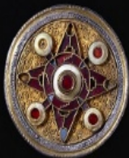
Broche de Wingham, 575-625 Inglaterra Plata dorada, granates, vidrio azul, concha

«Los pilares de Europa. La Edad Media en el British Museum» es fruto de un acuerdo entre la Fundación Bancaria "la Caixa" y el British Museum que permitirá presentar en nuestro país los fondos de la colección pública más importante del mundo, mediante cuatro grandes exposiciones que se presentarán en los ocho centros CaixaForum entre los años 2016 y 2020. En este caso, la procedencia de la mayoría de las obras, del norte de Europa, ofrece nuevos puntos de vista. La selección, muy esmerada, permite presentar una galería de obras maestras. Este conjunto extraordinario se complementa con obras del Museo Arqueológico Nacional, del Museu Nacional d'Art de Catalunya y del Museu Marès, que sirven de contrapunto desde la perspectiva de los reinos del sur.